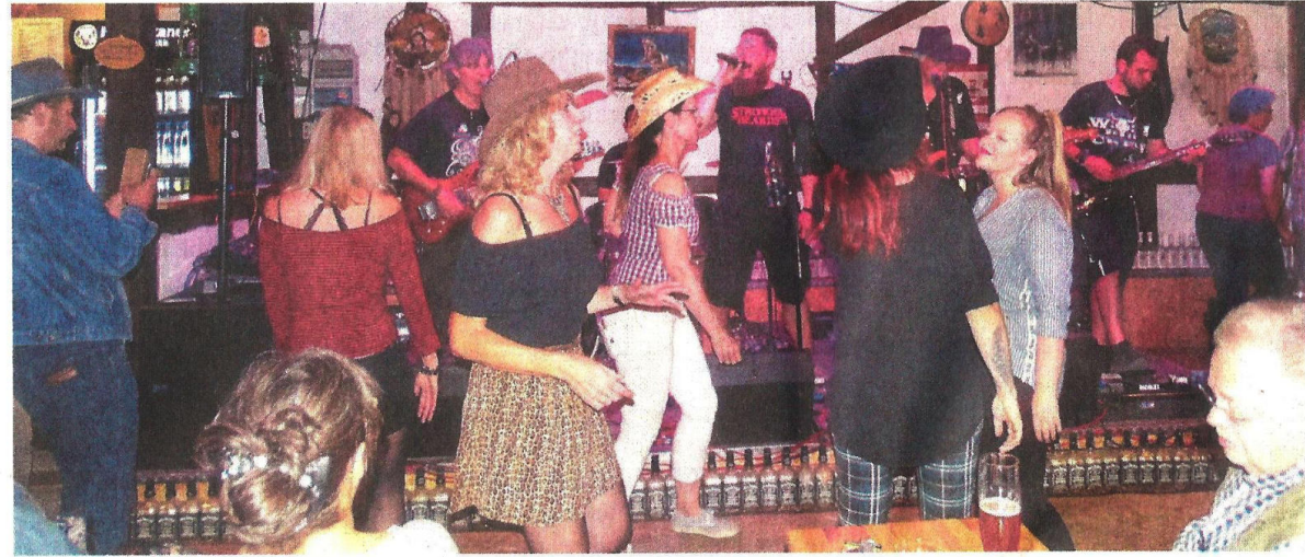
Die Stimmung ist gut, es wird gesungen und getanzt: Die Band Crew X tritt im Saloon der Harz Mountains Ranch in Bad Lauterberg auf.