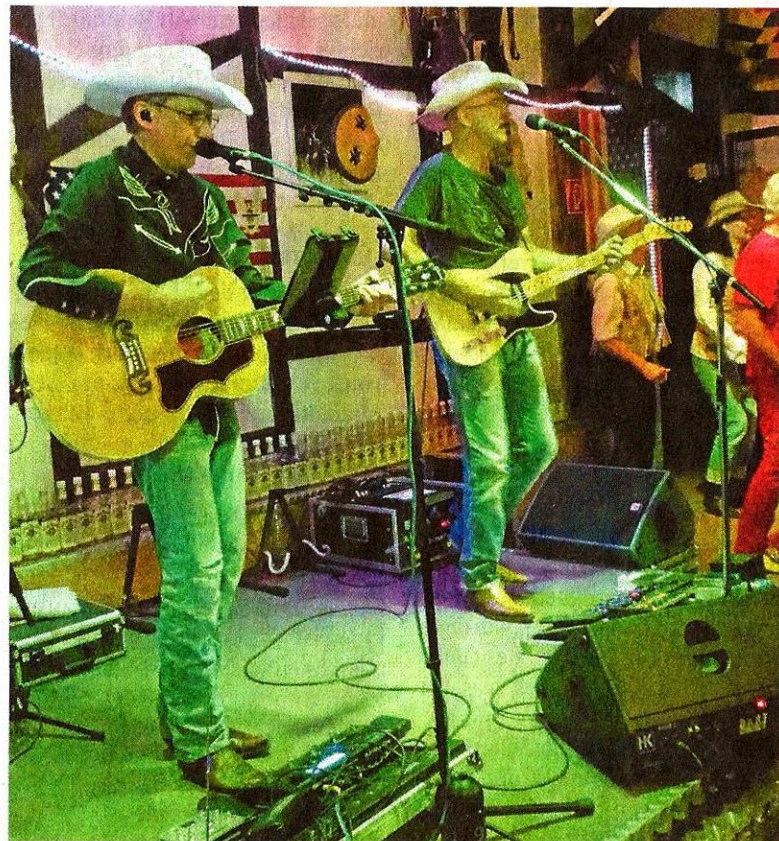
Blue Steel überzeugten mit rockigem Countrysound in der HM-Ranch – im Hintergrund tanzt die Line-Dance-Gruppe.